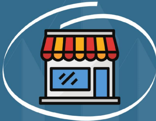
Master Franchise "Region"